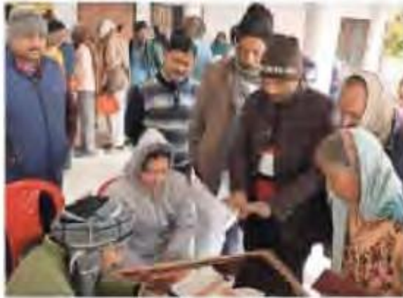
इटवा स्थित माता प्रसन्न इंटर कॉलेज में आयोजित कैंप में जांच कराते लोग।

कैंप में अलग-अलग कंडक्टर पर चिकित्सकों ने लोगों के सेहत को